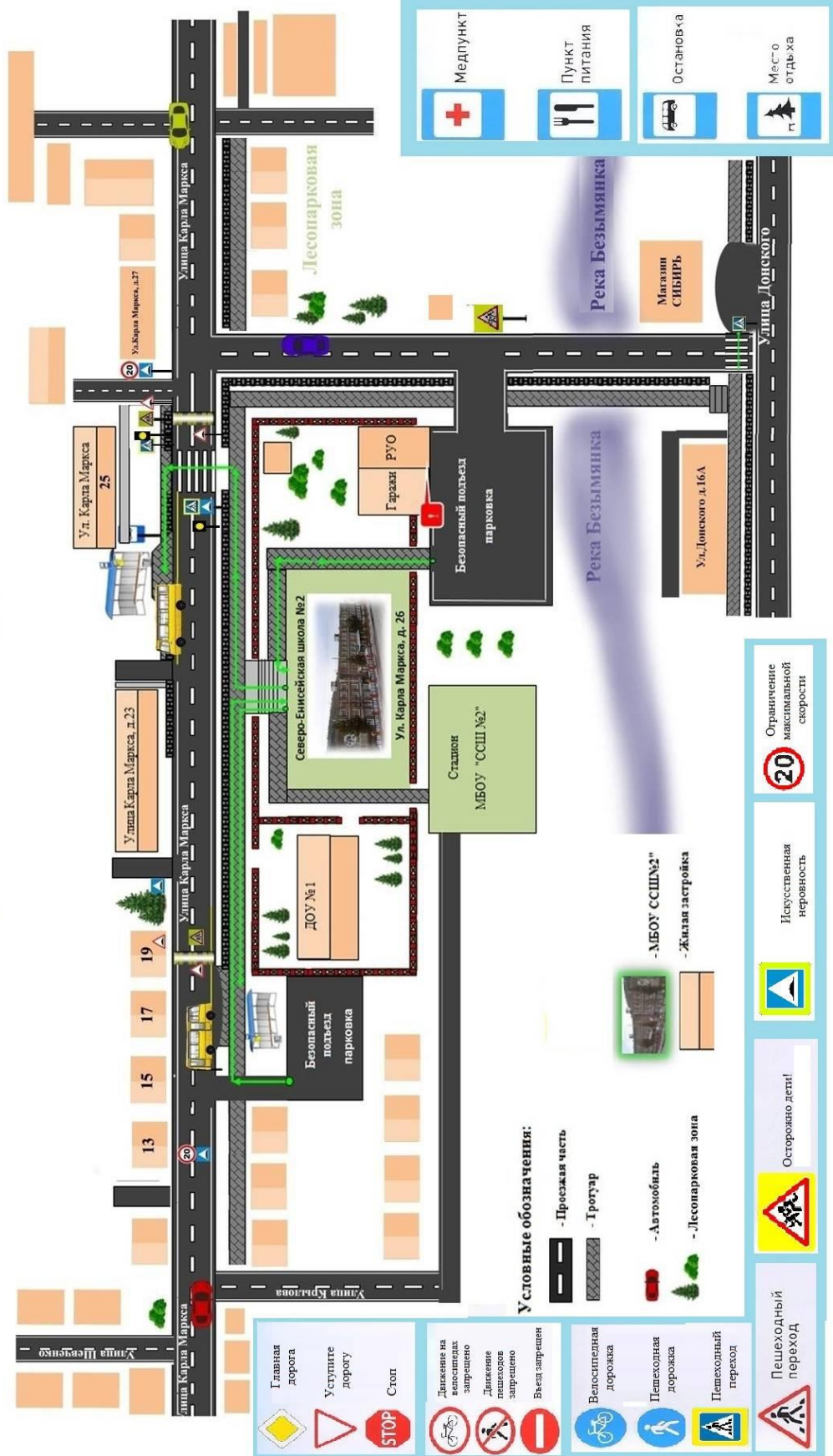
Схема безопасного маршрута движения детей "Дом-Школа-Дом" МБОУ "Северо-Енисейская средняя школа № 2"